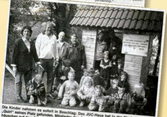
Die Kinder nahmen es sofort in Beschlag: Das JUC-Haus hat in der Kindertagesstätte „Quiri“ seinen Platz gefunden. Mitglieder des Jungunternehmerclub hat das solide Holzverstandlich kostenlos.

Rede und Antwort stand. Acht Mitglieder des JUC informierten sich über die Service-Leistungen des Kreises insbesondere für mittelständische Unternehmer. Mörs sagte den Jungunternehmern seine Unterstützung zu.