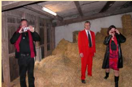
Neben Crime und Action zeichnen eben auch romantische Momente einen guten Film aus.