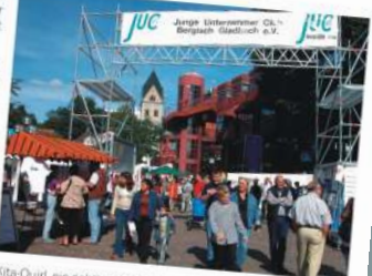
Kita-Quirl, ein richtiges Kinderhaus, gebaut auf einem der letzten Kultur- und Stadtfeste.

Außerdem hat der JUC eine Kooperation mit dem größten Fußballverein des Rheinisch-Bergischen Kreises, der SSG 09, begonnen, ganz besonders, als Mitglied des Jugendfördervereins.