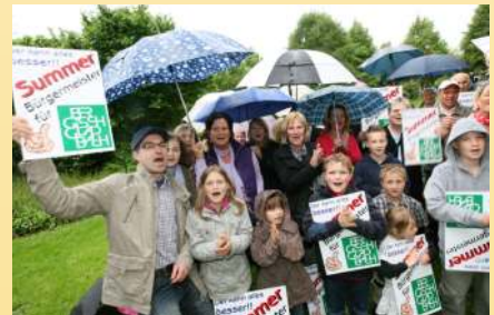
Die Menge tobt vor Begeisterung für den neuen und hoffnungsvollen Bürgermeisterkandidaten.