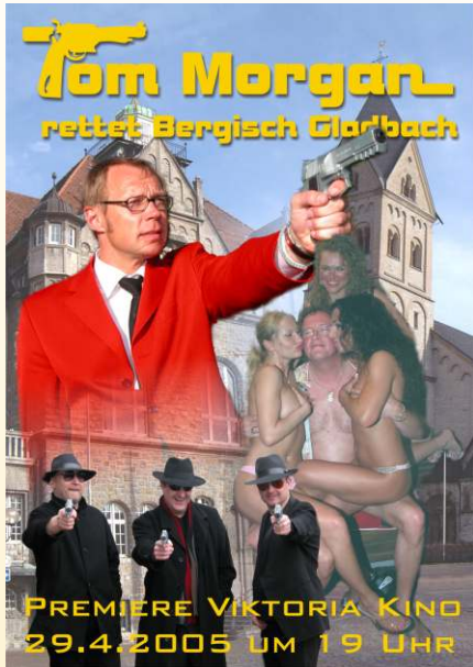
Das Filmplakat zu Teil 1.