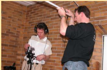
Aufwändige Technik in Bild und Ton wurde schon beim ersten Tom Morgan eingesetzt.