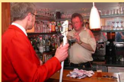
Die "Locations" wurden immer klug gewählt - hier das Einrichten des Filmsets in Ilias Bar.