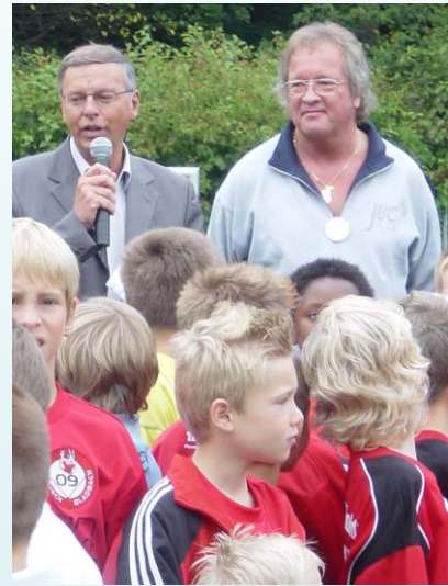
Wolfgang Bosbach bei der Eröffnung des JUC-Cup 2005.

Liebe Bürgerinnen, liebe Bürger, „Frage nicht was dein Land für dich tun kann, sondern frage, was du für dein Land tun kannst.“ (John F. Kennedy)