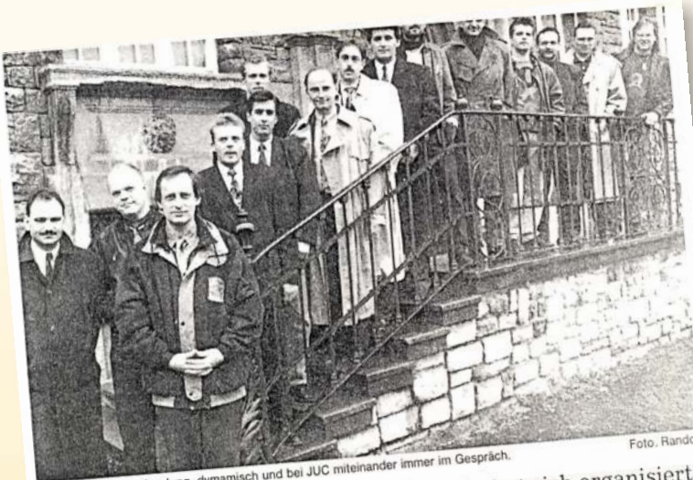
Die Chefs von heute: Jung, dynamisch und bei JUC miteinander immer im Gespräch.