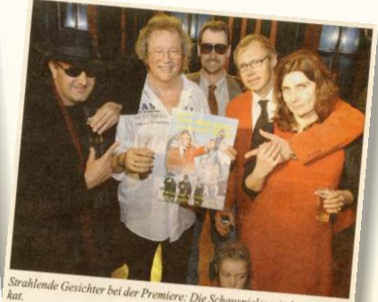
Strahlende Gesichter bei der Premiere: Die Schauspieler mit dem Filmplakat.

Wie im Jahr 1932: (von links) Krämer, Sprenger, Steinfeldt, Unrau, Schmitz, Niederhoff, Duske, Paas, Cramer von Clausbruch, Pleiß, Lüttgen. Die „Jungen Unternehmer“ aus Gladbach sprühen auf vor Ideen. (2) Aktion kostete einige Kraft schließlich sollte keine „abstürzen“