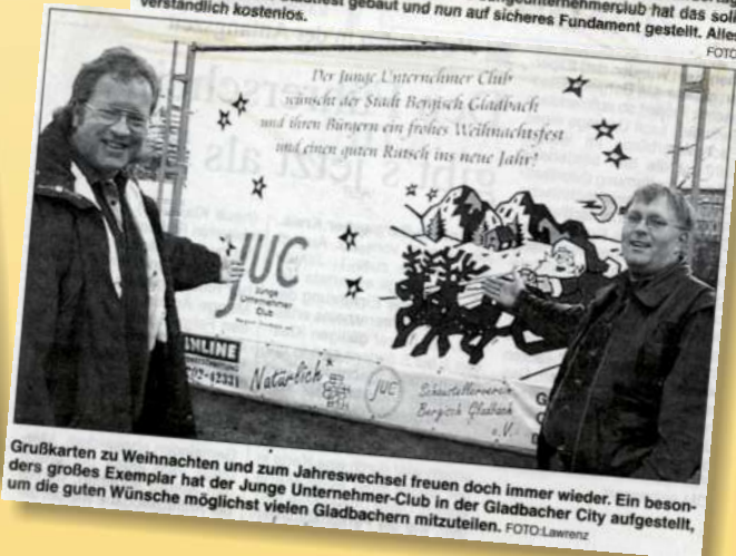
Grüßkarten zu Weihnachten und zum Jahreswechsel freuen doch immer wieder. Ein besonders großes Exemplar hat der Junge Unternehmer-Club in der Gladbacher City aufgestellt, um die guten Wünsche möglichst vielen Gladbachern mitzuteilen.