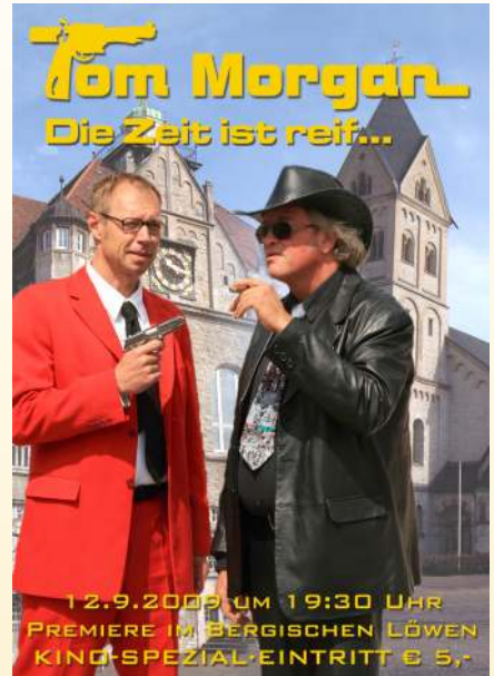
Das Filmplakat zu Teil 2.

Beide Filme sind übrigens als Doppel-DVD über Burkhardt Unrau (Tel. 022 02 / 5 67 14) zu beziehen.