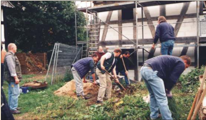
Junge Unternehmer für den Museumsverein Bensberg in Aktion.