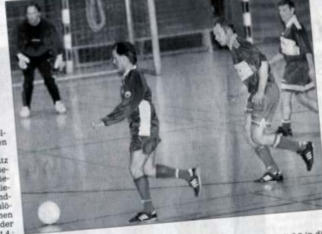
Weltmeister bleibt Weltmeister: Wolfgang Overath zeigte den Juc-Athleten, wo Bärlein den Most holt. Neunmal ver-senkten die Geißbock-Rehrner das Leder im Netz des Gigners. Aber es hat Spaß gemacht.

Fast 150 Mitarbeiter, aufgeteilt auf insgesamt elf Mannschaften, zeigten vor circa 500 Zuschauern ihre Schuss- und Dribbelkünste. Die humorvollen und selbstironischen Namen der Teams gaben Fingerzeige auf die Fachbereiche und Ressorts, denen die jeweilige Mannschaftswelt gehörte. Aus dem FB 9 entstammte: Aus dem FB 3 „Bau“ wurden die „Bensberger Bauhölzer“, aus den Klärwerkern die „Kanalratten“. Im zeitgleich stattfindenden Volleyballturnier traten die „Stolpersteine“ und das „Green Team“ an. Sowohl das Spiel um Platz drei, als auch das anschließende Finale wurden im Stenometer-Schießen entschieden. Dritter wurden letztendlich die „Bensberger Bauhölzer“. Das Endspiel gewannen die „Feuertüfel“ von der städtischen Feuerwehr mit 4:3 gegen ihre Zivis, die „Feuersalamander“. Sieger des Volleyball-Turniers wurden die „Raibaublocker“, die sich im Finale gegen „Blackjack“ durchsetzten. Nach Ende des eigentlichen Turniers wartete auf die Besucher noch ein besonderes Highlight: Eine Auswahl aus Ehemalern und Ehrenmitgliedern des 1. FC Köln wurde von den Hobbyspielern des „Junge Unternehmer-Clubs“ (JUC) herausgefordert. Dir-