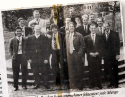
Der Verein der Gladbacher Jungunternehmer fokussiert jede Menge Know How. Die Fachleute helfen einander in allen Fragen.

Fortan ging man Probleme gemeinsam an. Und das hatte sich schnell herumgesprochen. Mittlerweile zählt der JUC e. V. stolze 22 Mitglieder aus zahlreichen Branchen: Anwaltskanzlei, Architektur, Bauvermittlung, Bedachungen, Bürovermietungen, Computertechnik, Elektrotechnik/Lichtdesign, Garten- und Landschaftsbau, Geldinstitut, Gerüstbau, Heizung und Sanitär, Immobilien, KFZ-Handel, Maler und Anstreicher, Metallbau, Möbel, Schreiner, Tiefbau/ Außenanlagen, Versicherungen, Webgestaltung, Wohnkul-