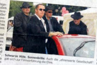
Schwarze Hüte, Sonnenbrille: Auch die „ehrenwerte Gesellschaft“ gab sich zur Filmvorführung die Ehre.

Besten Teppich, Blitzlichter, Applaus. In großen Schültern und entzückten sind die