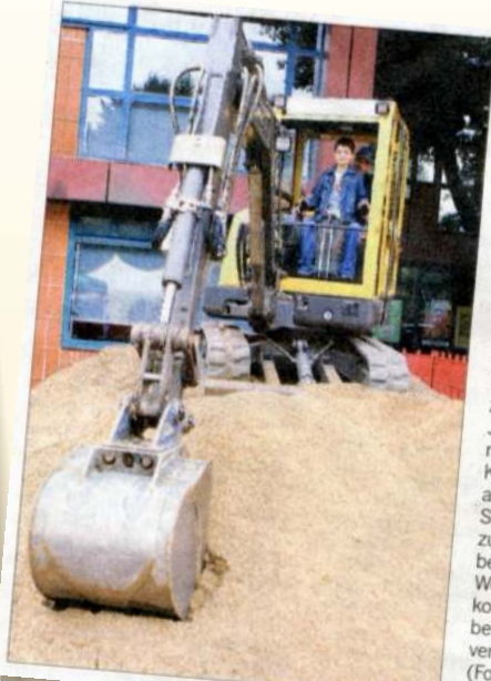
Während die Mädchen beim Kistenturmklettern Mumm bewiesen, wurden die Jungs magisch vom Bagger angezogen. Den JUC-Unternehmer Ludwig Krämer jun. als „Action-Spielzeug“ zum Stadtfest gesteuert. Wer wollte, konnte sich beim Buddeln versuchen.

Was im übrigen auch Landrat Norbert Mors (Bild rechts) vor sich sieht.